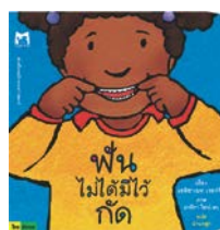
6) ฟันไม่ได้มีไว้กัด