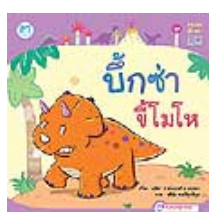
3) บ๊องซ่าซีโมโห