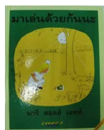
9) มาเล่นด้วยกันนะ