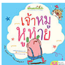
7) เจ้าหมูห่วย