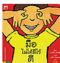
4) มือไม่ได้มีไว้ดี