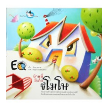
8) บ้านนี้มีเด็กซีโมโห