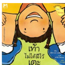
5) เท้าไม่ได้มีไว้เตะ